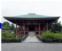
中宮寺 (特別拝観・昼食)