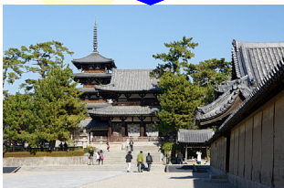
法隆寺 (入山はありません)